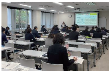
令和5年度の講座の様子