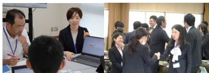
令和5年度の講座の様子