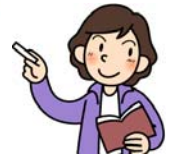
キャリア教育アンケート（中学校）（ ）年（ ）組

p38・p39の「資料1」を参照しながら、校内研修、学年会等で、アンケートの結果をもとに、自校の取組を考えてみましょう。