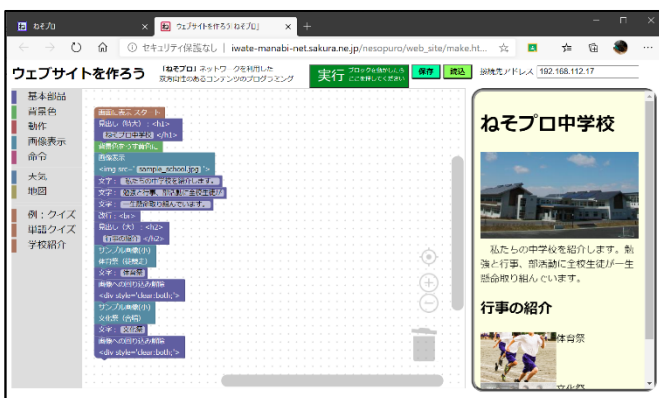
学校紹介の見本 (図 1)