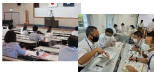
第10期生(令和3年度)の研修の様子