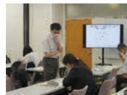
令和3年度の講座の様子