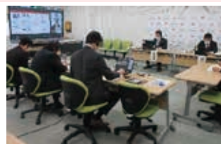
令和3年度研究発表会(オンライン配信)