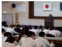
第9期生研修の様子