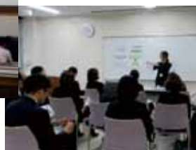
令和元年度福岡教師塾