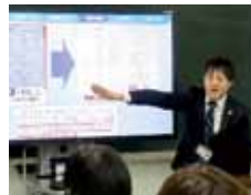
令和元年度の様子