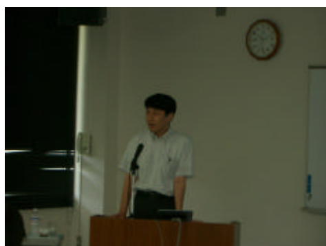
「講義 教育相談と人間関係能力育成」