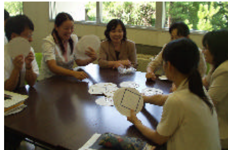
演習「仲間だドン」ゲームの様子